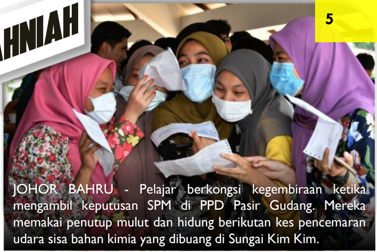
JOHOR BAHRU - Pelajar berkongsi kegembiraan ketika mengambil keputusan SPM di PPD Pasir Gudang. Mereka memakai penutup mulut dan hidung berikutan kes pencemaran udara sisa bahan kimia yang dibuang di Sungai Kim Kim.