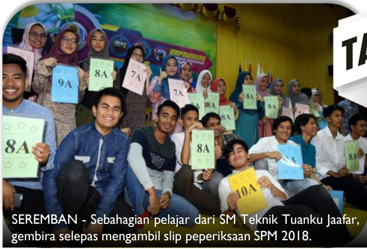
SEREMBAN - Sebahagian pelajar dari SM Teknik Tuanku Jaafar, gembira selepas mengambil slip peperiksaan SPM 2018.