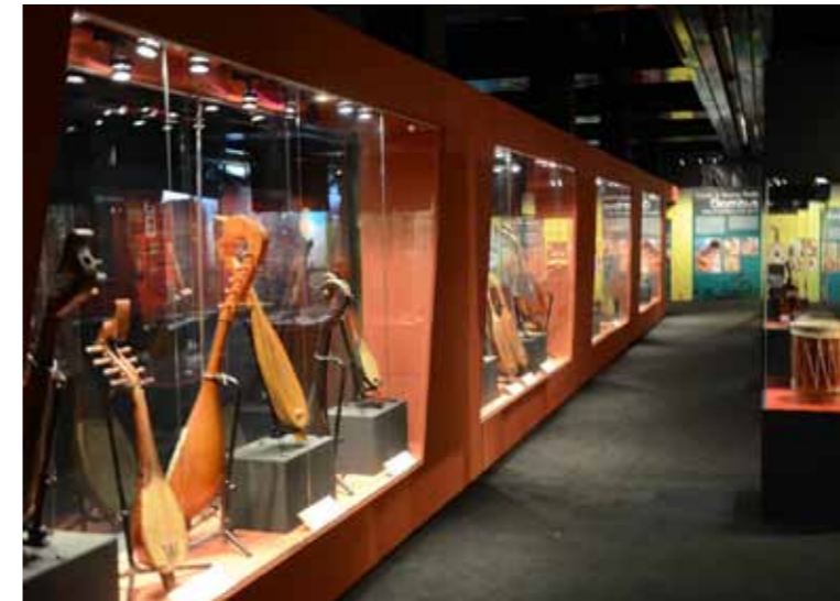
Peti pameran yang memperkenalkan pelbagai model gambus

Unit Pendidikan Muzium bertanggungjawab merancang dan mengadakan program pameran bergerak untuk pendedahan aktiviti dan fungsi jabatan samada di dalam dan luar negara, menyelaras program pameran yang berkaitan dengan agensi-agensi samada di bawah kementerian atau kerjasama dengan agensi-agensi luar, dan merancang serta melaksanakan program latihan berkaitan pameran terutama dari segi teknik persembahan pameran dan penggunaan teknologi terkini.