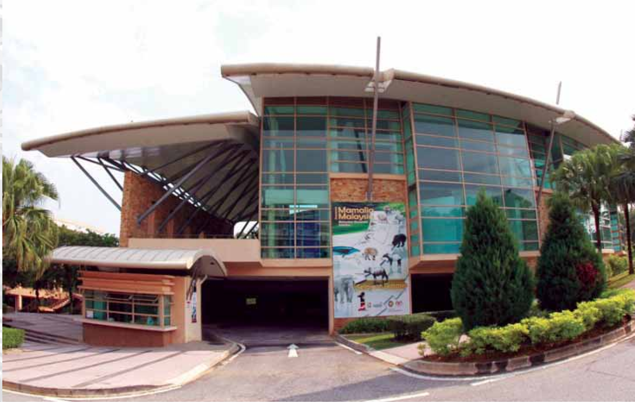
Muzium Alam Semula Jadi