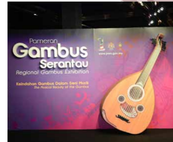
Ruang Hadapan Pameran Gambus Serantau

Unit Sumber Media bertanggungjawab merancang kerja-kerja studio fotografi melibatkan koleksi artifak jabatan, membuat pendokumentasian aktiviti melibatkan jabatan, membuat kerja editing berkaitan koleksi video jabatan, menguruskan katalog, inventori dan penyimpanan bahan rujukan bergambar mengikut kaedah yang ditetapkan dan memberi perkhidmatan rujukan, penyalinan foto dan perolehan bahan kepada penyelidik dan pameran.