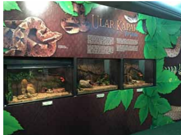
Poster Pengenalan Pameran Racun dan Bisa