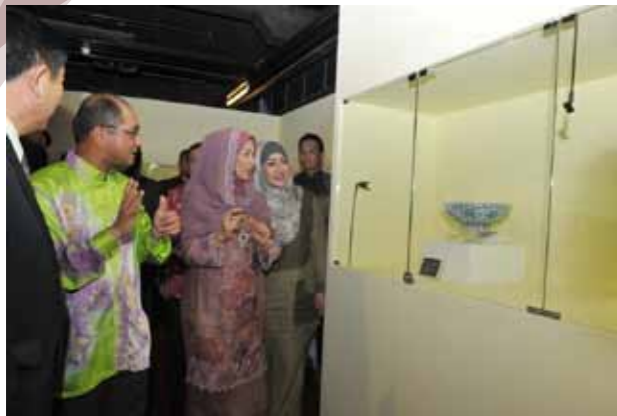
Pameran Porselin telah dirasmikan oleh Seri Paduka Baginda Raja Permaisuri Agong Tuanku Hajah Haminah