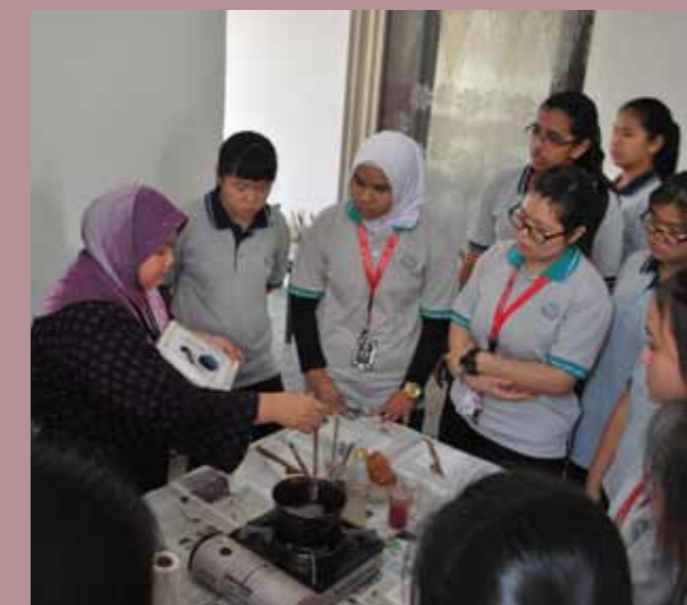
Gambar Aktiviti-Aktiviti Yang Dijalankan Oleh Unit Pendidikan Muzium