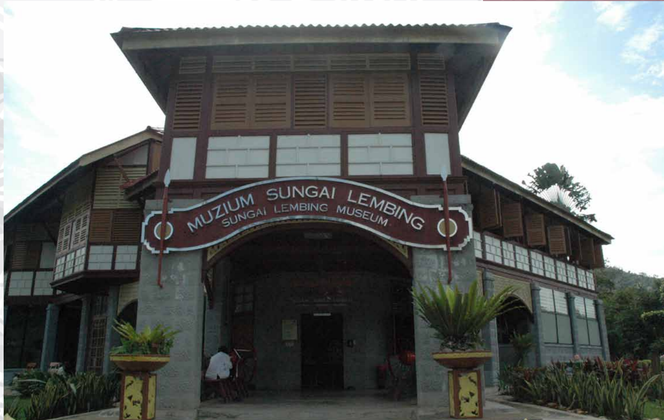
Muzium Sungai Lembing

PEMERKASAAN MODAL INSAN DAN PEMANTAPAN KEUPAYAAN DAN KAPASITI ORGANISASI