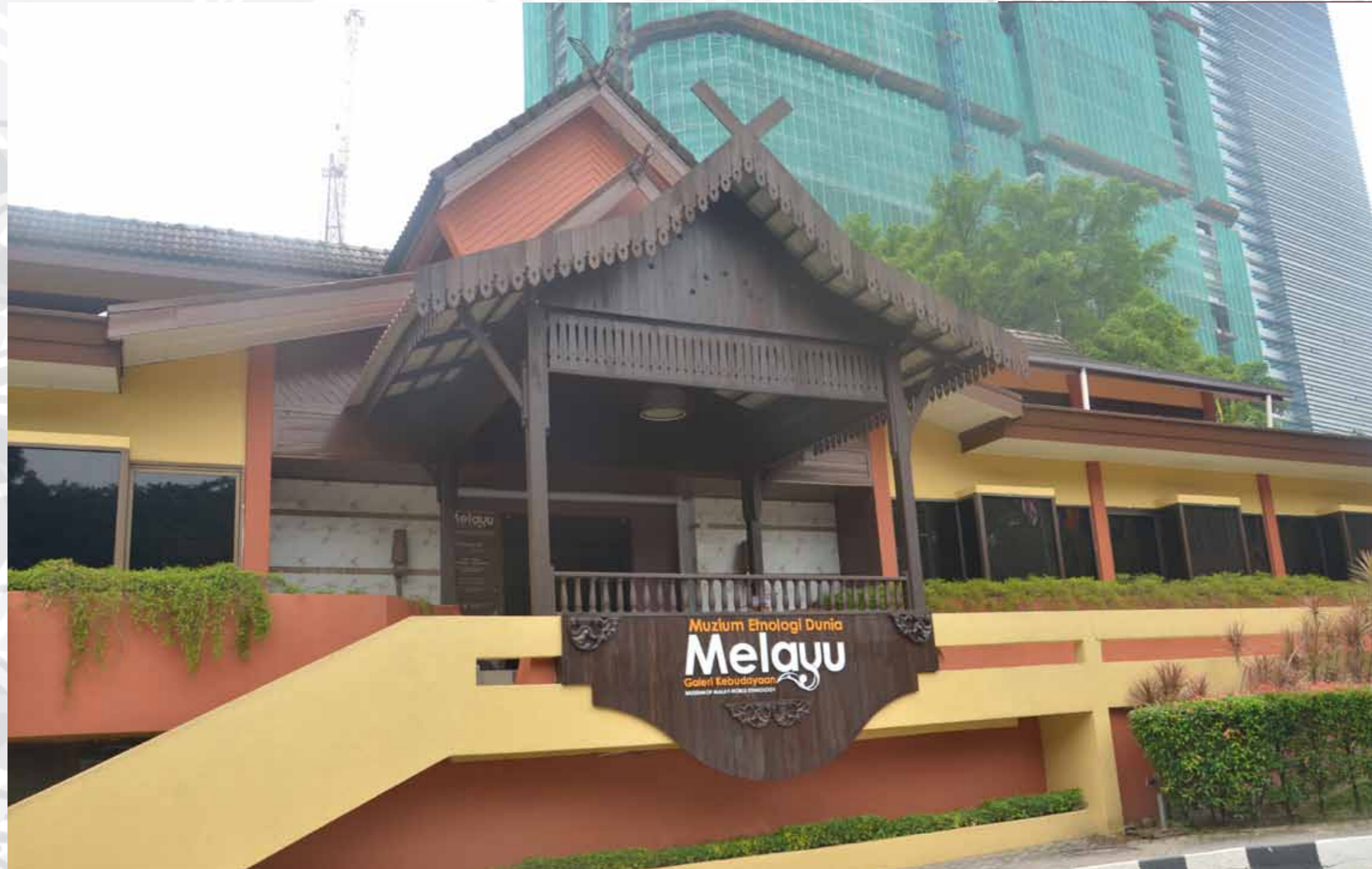
Muzium Etnologi Dunia Melayu