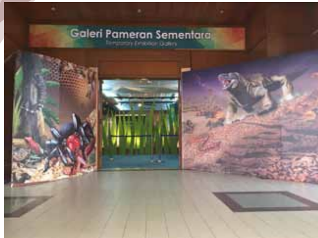
Pintu masuk ke Pameran Racun dan Bisa