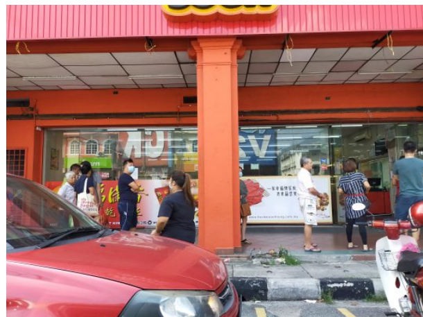
Orang ramai sedang beratur untuk membeli makanan