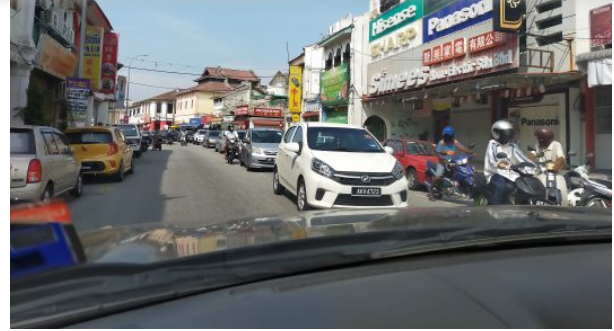
Kenderaan masih banyak di jalan raya

auan hari ke tiga Pelaksanaan Kawalan Pergerakan di beberapa kawasan di sekitar Ipoh dan Batu Gajah, masih kelihatan orang ramai yang keluar dari rumah seolah-olah tiada apa yang berlaku. Mereka dilihat melakukan aktiviti membeli belah tanpa ada perasaan gusar tentang penyebaran wabak COVID 19 yang melanda negara ketika ini.