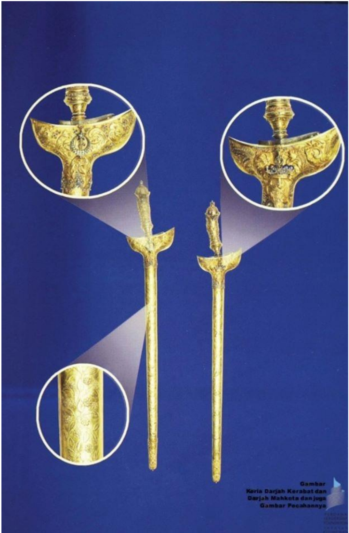
Gambar Keria Darjah Kerabat dan Darjah Mahkota dan juga Gambar Pecahannya