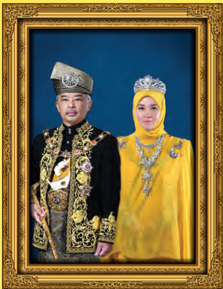
KEBAWAH DULI YANG MAHA MULIA SERI PADUKA BAGINDA YANG DI-PERTUAN AGONG XVI AL-SULTAN ABDULLAH RI'AYATUDDIN AL-MUSTAFA BILLAH SHAH IBNI ALMARHUM SULTAN HAJI AHMAD SHAH AL-MUSTA'IN BILLAH