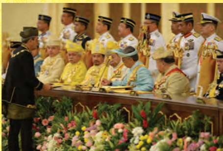
Istiadat Melafaz dan Menandatangani Sumpah Jawatan Yang di-Pertuan Agong XVI pada Mesyuarat Majlis Raja-raja ke-252 (Khas) di Balairung Seri, Istana Negara pada 31 Januari 2019.