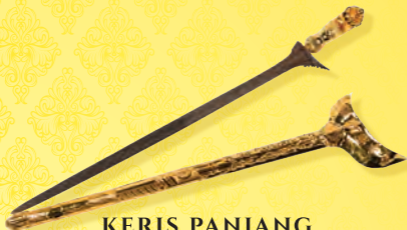
KERIS PANJANG DIRAJA