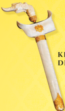
KERIS PENDEK DIRAJA