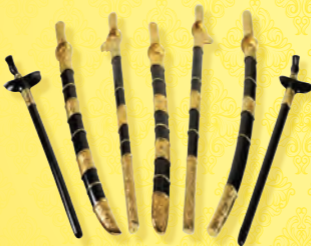
PEDANG, KERIS PANJANG DAN SUNDANG DIRAJA