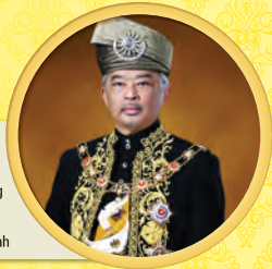
16 PAHANG (31 JANUARI 2019 – SEHINGGA KINI)

Seri Paduka Baginda Yang di-Pertuan Agong Sultan Muhammad V