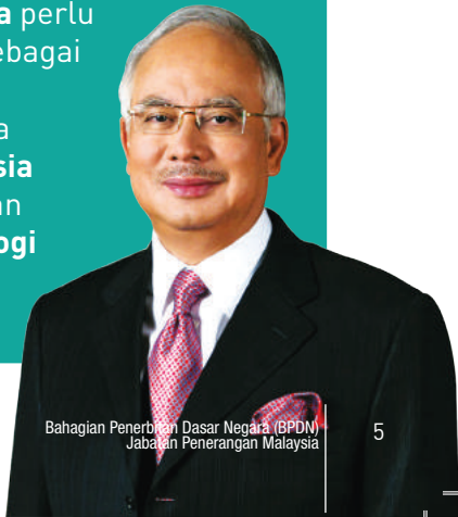
Bahagian Penerbitan Dasar Negara (BPDN) Jabatan Penerangan Malaysia

Kerajaan juga amat memandang serius terhadap pengukuhan perpaduan nasional dan unsur negatif yang boleh memecah belahkan kesepakatan antara kaum . Untuk menjadi sebuah Negara Bangsa yang penuh dengan tatasusila dan kesantunan keperibadian, nilai murni dalam penghayatan pada intipati Rukun Negara perlu diperhalusi sebagai benteng asas kepada semua rakyat Malaysia untuk dijadikan sebagai ideologi negara yang ulung.