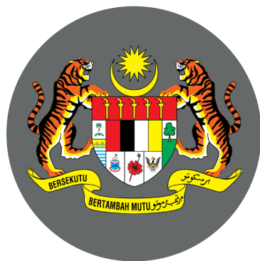
Pejabat Perdana Menteri Putrajaya, Malaysia

S EJAK lebih lima dekad yang lalu, negara Malaysia yang kita cintai ini telah tertubuh dengan gabungan Persekutuan Tanah Melayu bersama-sama dengan Singapura, Sabah dan Sarawak. Penyatuan keramat di antara wilayah-wilayah ini telah membentuk satu Persekutuan yang unggul dalam mendepani cabaran politik dan ancaman pegganas Komunis yang sedang memuncak. Kehadiran negara baru yang berkecuali ini akhirnya menstabilkan keadaan dan landskap politik di Asia Tenggara yang sedang bergelora. Seharusnya kita sebagai rakyat Malaysia, bersyukur dan merasa bertuah kerana dengan penubuhan negara kita ini telah membawa kemanan dan harapan baru serantau pada ketika itu.