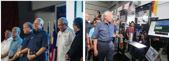
YAB Perdana Menteri, pada majlis pelancaran TVET Malaysia di Pusat Latihan Tinggi (ADTEC), Shah Alam pada 27 September 2017.

Dana sebanyak RM4.6 bilion yang diperuntukkan pada tahun 2017, iaitu tahun kedua dalam pelaksanaan Rancangan Malaysia Ke-11 (RMK-11) kepada semua institusi kemahiran teknik dan vokasional adalah bukti keseriusan kerajaan memperkasakan pendidikan itu bagi membantu memantapkan sektor industri negara ini. Dalam Bajet 2017 yang dibentangkan oleh YAB Perdana Menteri, Dato' Sri Mohd Najib Tun Abdul Razak mengumumkan bahawa melalui dana berkenaan kerajaan antara lainnya akan mengubah suai sembilan kampus Institut Pendidikan Guru (IPG) menjadi Politeknik dan Kolej Vokasional. Daripada jumlah tersebut, empat buah IPG akan menjadi politeknik, empat Kolej Vokasional dan sebuah lagi sebagai pusat latihan jurulatih teknik dan vokasional. Inisiatif kreatif ini memperuntukkan sejumlah RM400 juta.