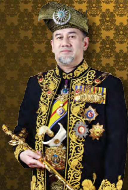
Kebawah Duli Yang Maha Mulia Seri Paduka Baginda Yang di-Pertuan Agong XV Sultan Muhammad V