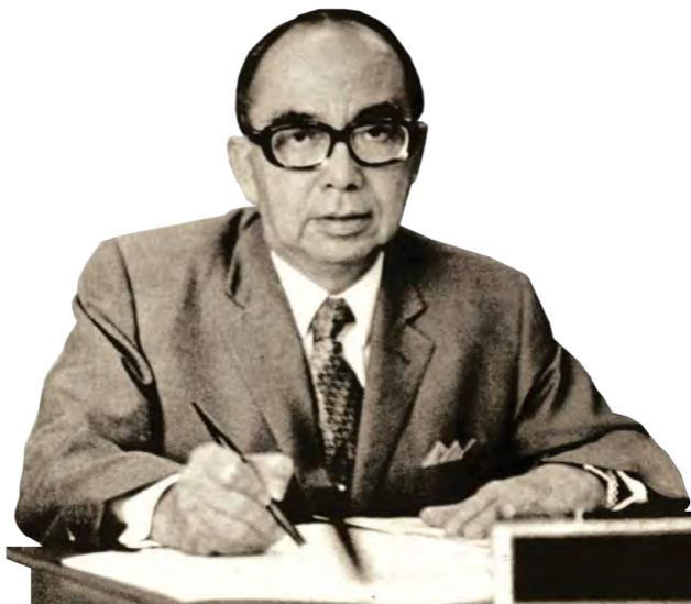
Tun Abdul Razak bin Dato' Hussein